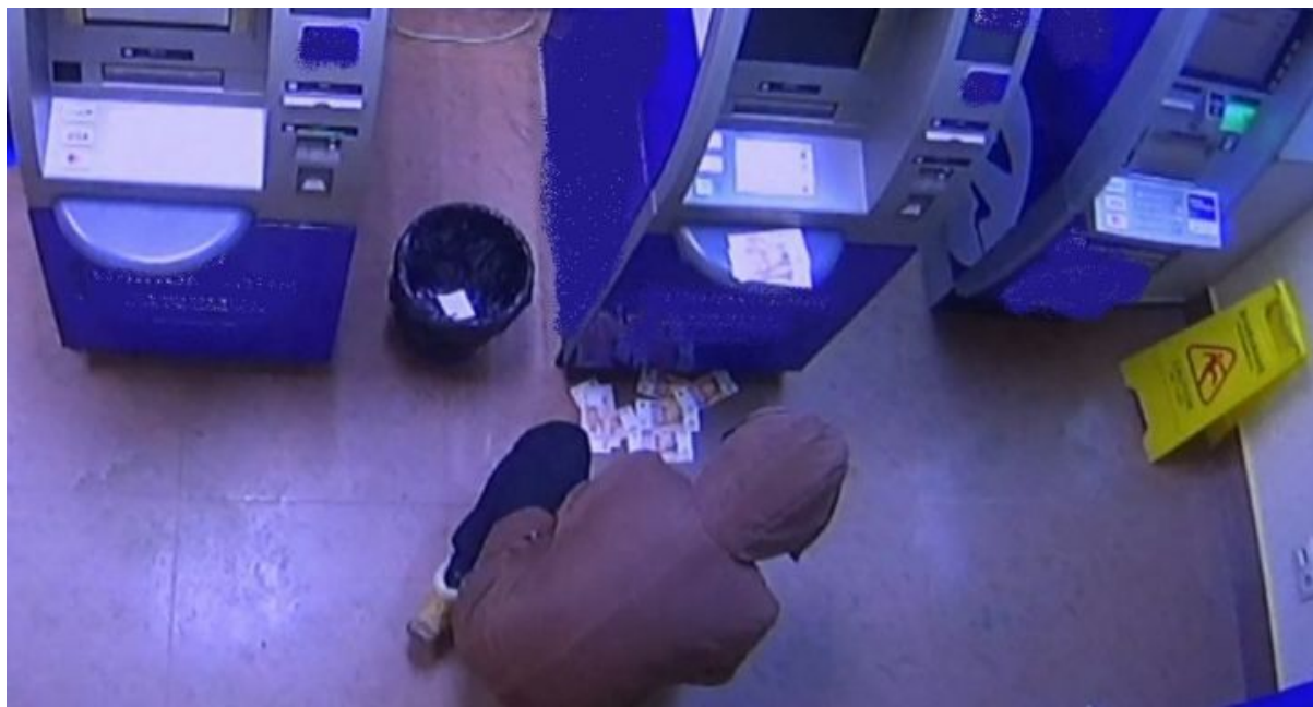
Фрагмент записи с камер наблюдения в момент кражи денег из банкомата

Эта статья посвящена анализу и выявлению закономерностей в преступлениях, направленных на кражу денег банков или их клиентов.